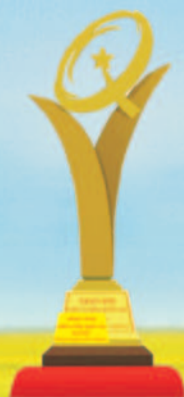
GIẢI VÀNG CHẤT LƯỢNG QUỐC GIA